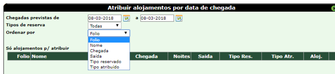
Figura 2 – Atribuir alojamento por data de chegada

A opção de atribuição de alojamentos inclui um novo filtro que permite indicar o tipo de ordenação a exibir as reservas, nomeadamente por Fólio , Nome , Chegada , Saída , Tipo reservado e Tipo atribuído .